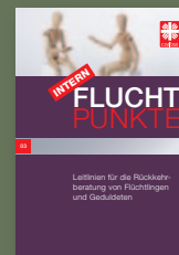
Fluchtpunkte intern 03/September 2017: Leitlinien für die Rückkehrberatung von Flüchtlingen und Geduldeten