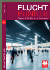
Fluchtpunkte 01/Januar 2014: Flughafenverfahren

In der Reihe „Fluchtpunkte“ sind bereits erschienen: