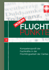
Fluchtpunkte intern 02/Dezember 2016: Kompetenzprofil der Fachkräfte in der Flüchtlingsarbeit der Caritas