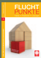
Fluchtpunkte 04/Dezember 2016: Von der Unterbringung zum Wohnen

In der Reihe „Fluchtpunkte intern“ sind bereits erschienen: