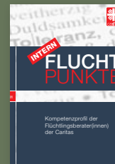
Fluchtpunkte intern 01/November 2014: Kompetenzprofil der Flüchtlingsberater(innen) der Caritas

In der Reihe „Fluchtpunkte intern“ sind bereits erschienen: