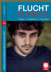
Fluchtpunkte 02/Februar 2014: Unbegleitete minderjährige Flüchtlinge