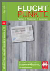
Fluchtpunkte 03/März 2014: Abschaffung Asylbewerberleistungsgesetz